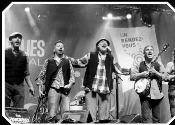
Les Tireux d'Roche Folk trad festif