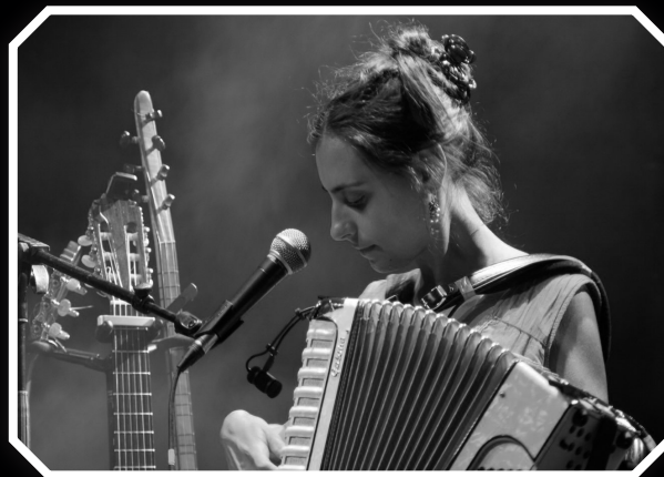
Imaz'Elia Trad Métissé