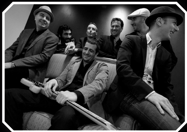
LP Septet Electro Funk Jazz